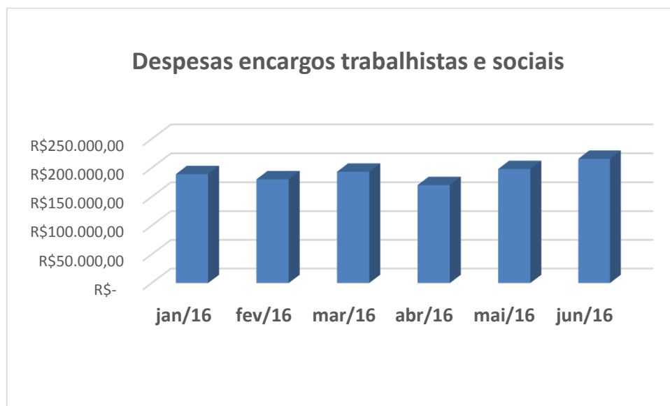
Gráf. 02. Evolução das despesas com encargos sociais e trabalhistas nos meses do primeiro semestre de 2016.

O gráfico 02 traz a evolução dos valores pagos relativos aos encargos sociais e trabalhistas durante o primeiro semestre de 2016.