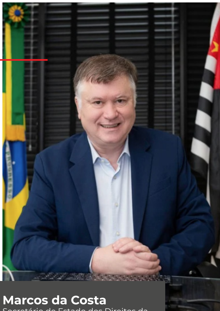
Marcos da Costa Secretário de Estado dos Direitos da Pessoa com Deficiência de São Paulo

Março também foi um mês de valorização da cultura, da inclusão social e da conscientização. Recebemos no Museu da Inclusão uma exposição marcante em homenagem aos 80 anos da Fundação Dorina Nowill, promovemos ainda ações no Dia Internacional da Síndrome de Down, como o torneio de futsal inclusivo, realizamos debates sobre doenças raras, reforçamos a pauta da acessibilidade como diferencial estratégico no setor de hospitalidade e, por fim, reafirmamos nosso compromisso com a proteção e o protagonismo das mulheres com deficiência. Investimos na qualificação de profissionais, no fortalecimento de serviços como o Centro de Apoio Técnico e no lançamento de cursos voltados ao atendimento especializado de vítimas de violência.