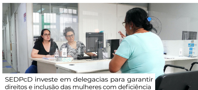
SEDPCD investe em delegacias para garantir direitos e inclusão das mulheres com deficiência

destaca o protagonismo de Dorina Nowill que, enquanto mulher, construiu uma instituição de impacto social em um contexto em que a atuação feminina na liderança institucional enfrenta inúmeros obstáculos. A programação reforça a reflexão sobre representatividade, igualdade e participação feminina, em diálogo direto com o legado deixado pela fundadora.