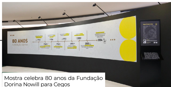
Mostra celebra 80 anos da Fundação Dorina Nowill para Cegos