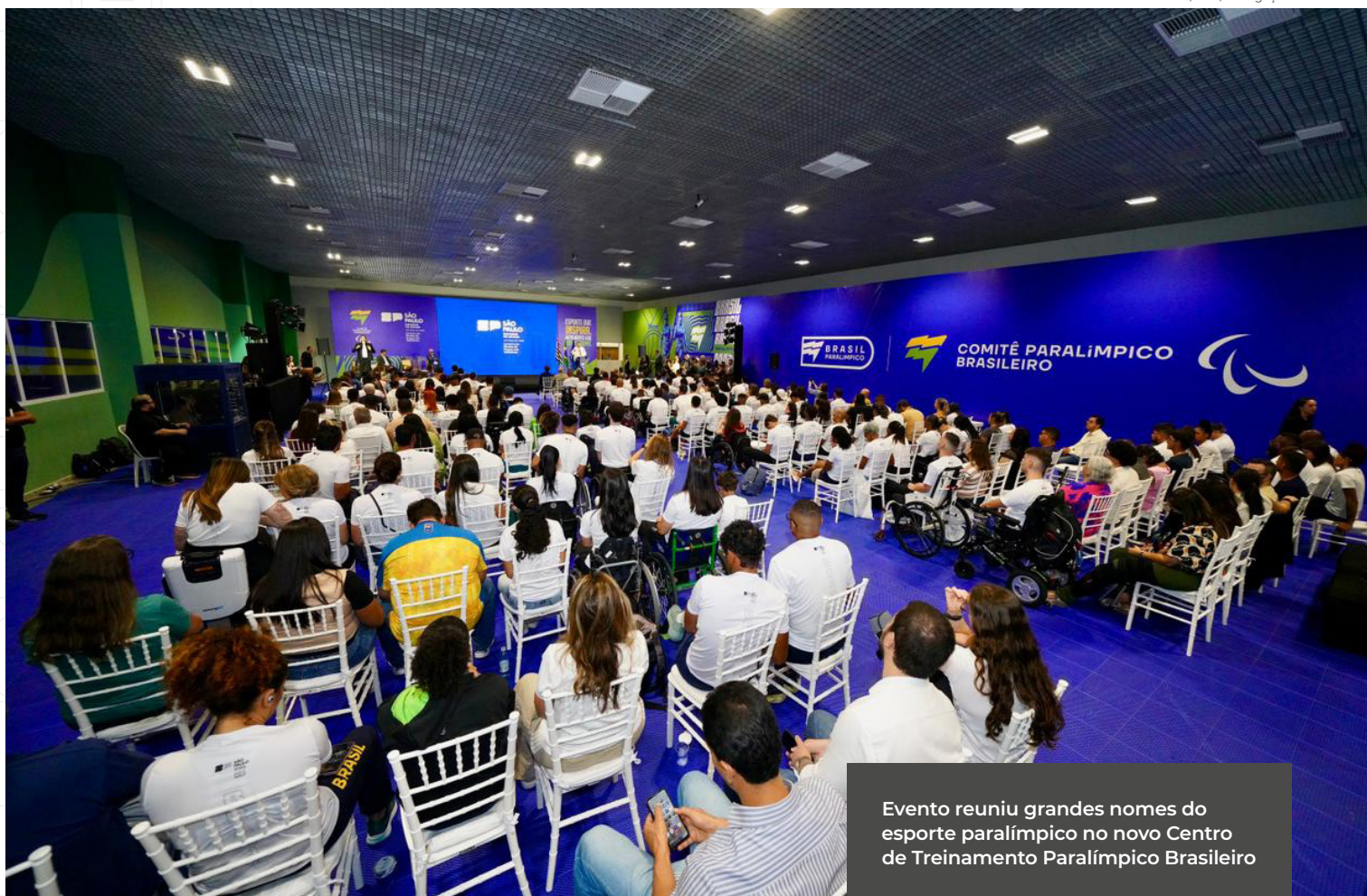
Evento reuniu grandes nomes do esporte paralímpico no novo Centro de Treinamento Paralímpico Brasileiro

O Governo do Estado de São Paulo por meio da Secretaria de Estado dos Direitos da Pessoa com Deficiência (SEDPcD) realizou, no Centro de Treinamento Paralímpico Brasileiro (CTPB), um evento para comemorar os 15 anos do Time São Paulo, uma das principais iniciativas de fomento ao esporte paralímpico no país.